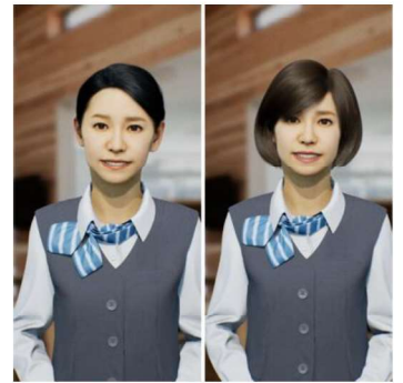
KSIN アバターイメージ

「KSIN」は、これまでデジタル・フロンティアが、映画やドラマ、ゲームなどのエンタテインメント分野における映像制作などで培ってきた最先端の 3DCG 技術の知見を活用し開発した高精密なアバターを搭載した遠隔接客サービスです。2022 年 7 月に β 版をリリースし、操作する人の表情の動きをリアルタイムかつ表情豊かに再現してスムーズに接客できる点などが高く評価され、東日本高速道路株式会社の第 1 期アクセラレータープログラム『E-NEXCO OPEN INNOVATION PROGRAM』に採択。サービスエリアにおける接客や窓口業務などの実証実験を行ってまいりました。